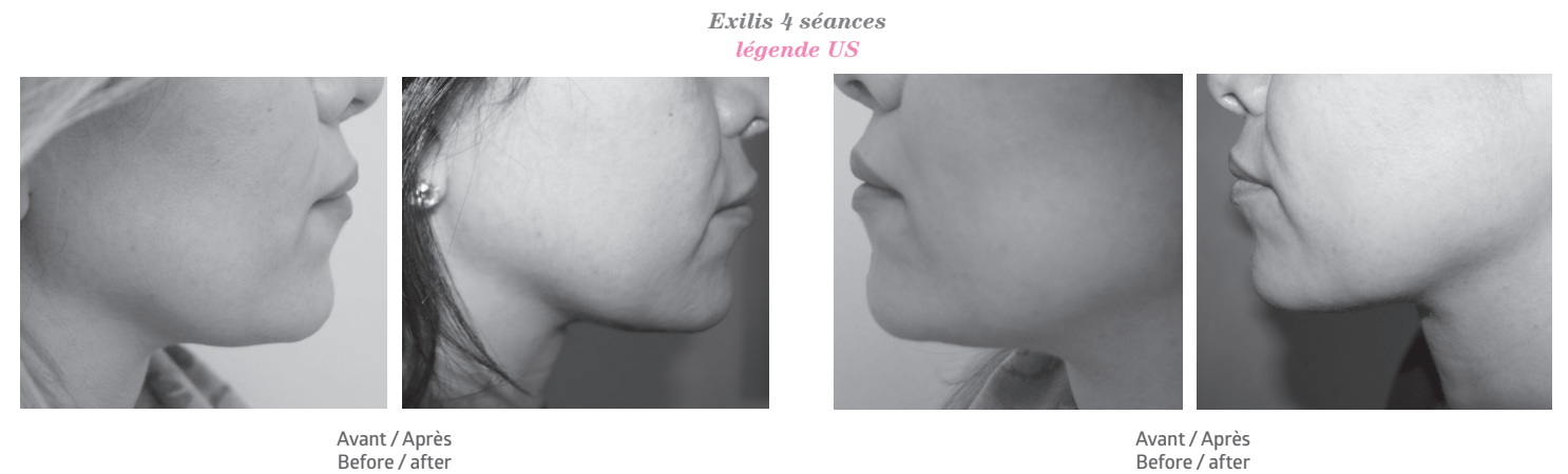
Exilis 4 séances légende US

The BTL Vanquish ME is a liposculpture and body shaping device that uses contactless multipolar radiofrequency technology. This FDA-approved technology selectively heats up fat (to between 45 and 50°), leading to the necrosis of the fat cells (apoptosis) which reduces fat thickness. We can therefore reshape the body (liposculpture) in a non-invasive way. The BTL Vanquish ME boasts the largest hand piece currently available on the market to treat abdominal fat, as well as a Flex hand piece that can treat the inner thighs or hips, without contact, pain or downtime. We recommend four to six 30 to 45-minute sessions (according to the patient's morphology),